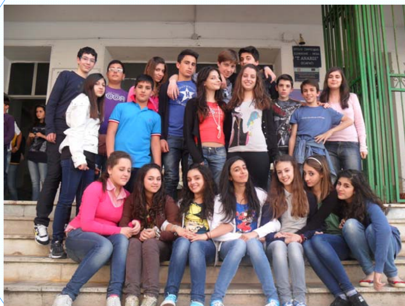
FOTO di gruppo a.s. 2010/11