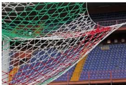
la rete tricolore