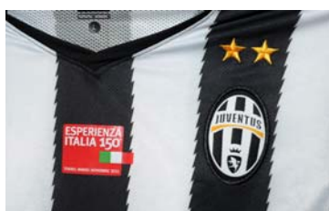
La maglia celebrativa - testimonial